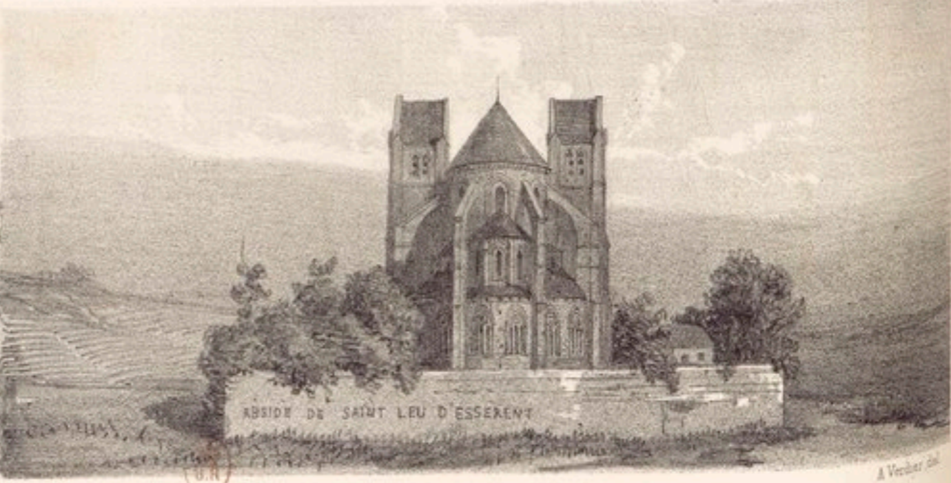
ABBAYE DE SAINT LEU D'ESSERENT