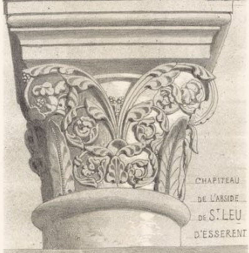
CHPITEAU DE L'ABSIDE DE S. LEU D'ESSERENT