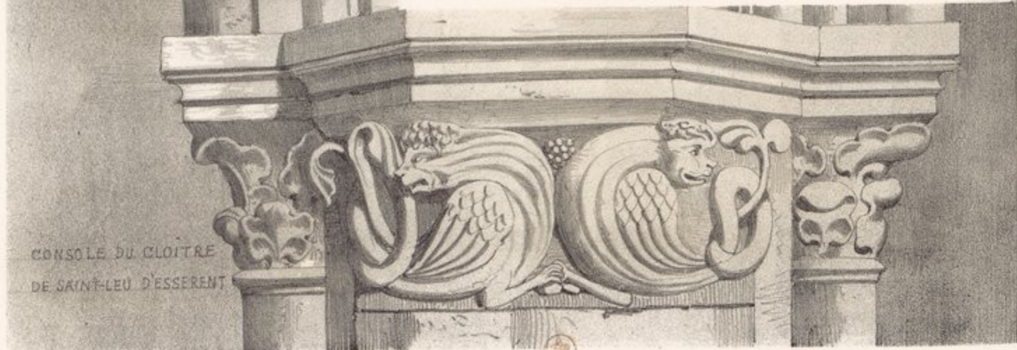
CONSOLE DU CLOITRE DE SAINT-LEU D'ESSERENT

truit en 1495. Sur sa façade on a placé il y a quelques années l'inscription suivante : Mon heur a prins son commencement en la ville de Senlis, dont il s'est depuis semé et augmenté par tout nostre royaume. Ces mots sont extraits des lettres patentes de 1590 par lesquelles Henri IV témoigne aux habitants de Senlis sa gratitude pour leur fidélité à sa cause.