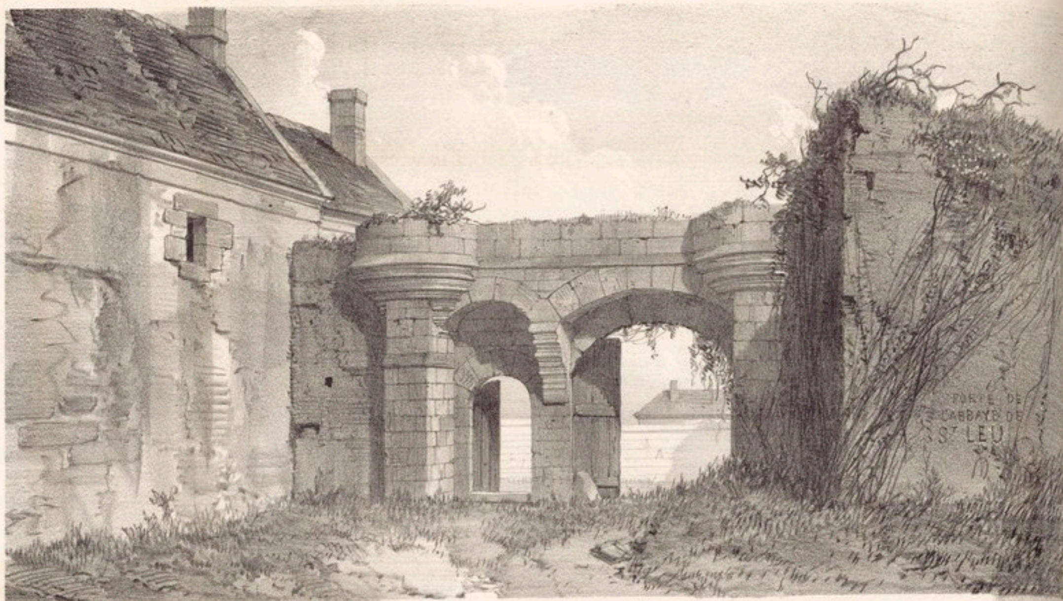
PORTE DE L'ABBAYE DE SAINT LEU