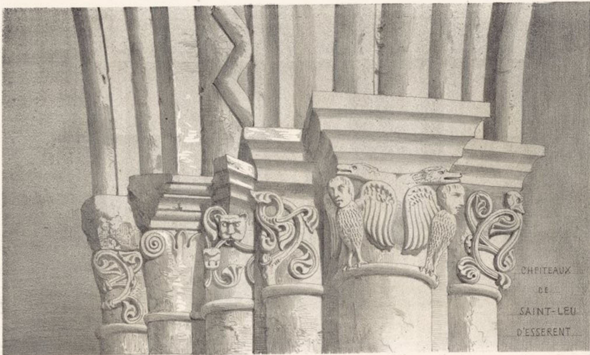
CHPITEAUX DE SAINT-LEU D'ESSERENT