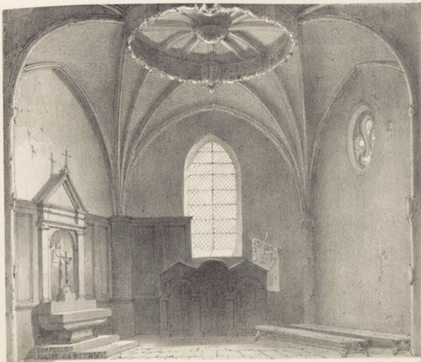
CHAPELLE EGLISE DE BITRY

flamboyant; une haute pyramide octogone lui sert de clocher.