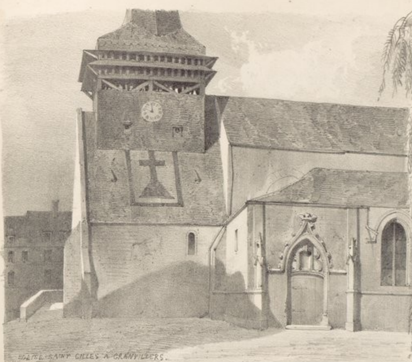
ÉGLISE SAINT GILLES A GRANDVILLIERS.

monastère, et précepteur du dauphin, vint donner des consolations aux habitants de Grandvilliers, en 1683, à l'occasion d'un violent incendie qui détruisit toutes les maisons, à l'exception de six ou sept seulement.