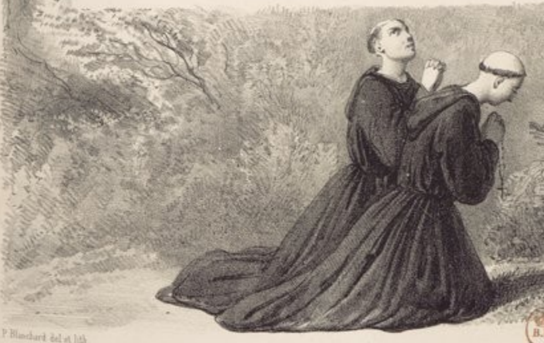
P. Blanchard del et lith