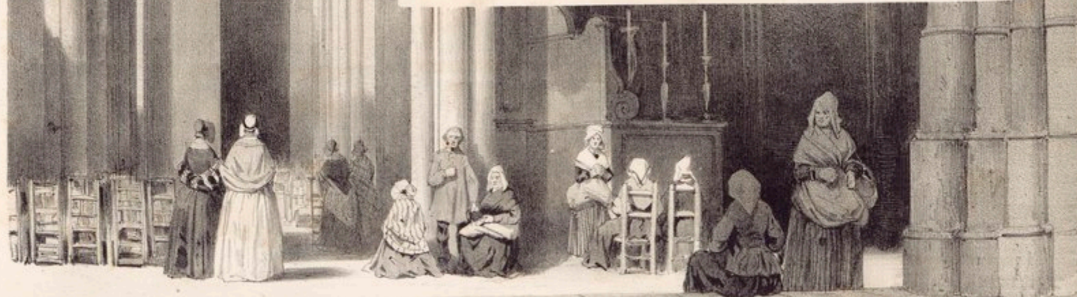
EGLISE DE CLERMONT.

D'autres événements recommandent le château et la ville de Clermont. Charles le Bel reçut le jour dans le château en 1294; Philippe de Valois y signa, au mois d'août 1338, les lettres par lesquelles il conféra à la reine le gouvernement du royaume pendant son absence. Le roi de Navarre et le dauphin eurent ensemble une longue conférence sur le marché de Clermont, en 1358; mais cette conférence n'apporta aucun remède aux malheurs de la France, et la guerre continua à désoler le Beauvoisis. Dans le siècle suivant, en 1472, Clermont fut choisi vainement pour négocier la paix entre le roi de France et les ducs de Bourgogne et de Bretagne. Les envoyés de ces princes n'ayant pu s'entendre, les hostilités reprirent avec une nouvelle fureur. Plusieurs ordonnances furent rendues par Charles V et